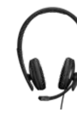
Serie ADAPT 100