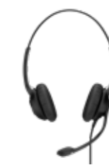
Serie IMPACT 200