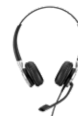
Serie IMPACT 600