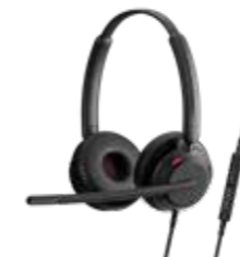
Serie IMPACT 700