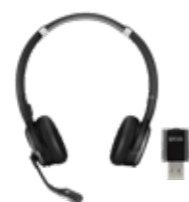
Serie IMPACT 5000