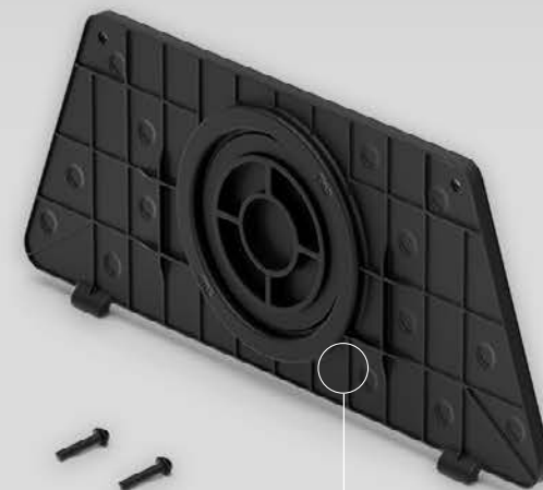
Soporte de sobremesa