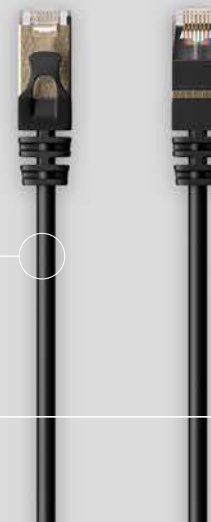
Cable Power over Ethernet (PoE)