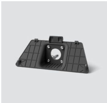
Control - WM 01