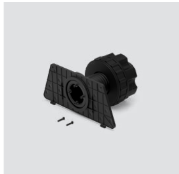
Control - DM 01